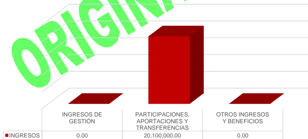
Gráfico 1. Ingresos